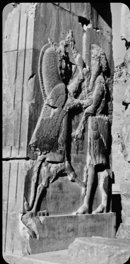
1966 - Palacio de Apadana en Persepolis. El Rey luchando contra el Mal. Ahriman -

Además, los restos óseos presentan también huellas de estrés ocupacional (entesopatías) o deformaciones provocadas por movimientos continuos de la dentición o de ciertas extremidades, el transportar cargas pesadas, trabajar fibras duras, adoptar posturas inconvenientes, etcétera, muchas de ellas resultado de actividades productivas de índole doméstica — como la molienda de elementos duros — o artesanal, como el alisar fibras con la dentición. Este tipo de estudios se puede contrastar con el resultado del análisis de las actividades presentes en cada espacio familiar.