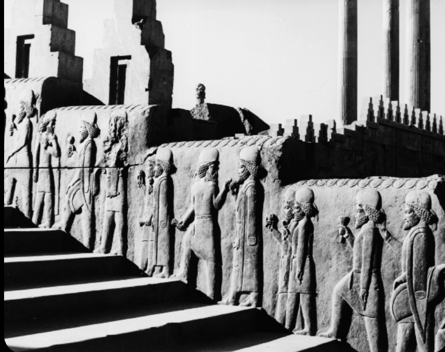
1966 - Persepolis, Irán. El palacio de Darío (siglo VI antes de Cristo). Relieves Despfile de funcionarios tallados en la escalera que conduce a la Casa privada del Emperador.

sible analizar al individuo en tanto que esqueleto para estudiar las marcas de estrés ocupacional, pero también los instrumentos que acompañan a los entierros particulares. En los productos mismos podemos ver, para el caso de la cerámica, los dermatoglifos (huellas digitales) que a menudo quedan impresos en la cerámica enrollada o alisada, o las marcas con las que los alfareros distinguen su producción.