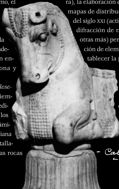
1966 - Ruinas de Persepolis Capital de una de las columnas del Palacio - Cabeza de toro -

Los restos óseos humanos. Por otro lado está la información que el análisis de los restos óseos humanos proporciona. Más allá de aspectos como evaluación de sexo, edad, índices y mediciones, aun cuando las deficiencias nutricionales no necesariamente dejan evidencia en el hueso, a menudo es posible detectar en los restos óseos los efectos del tipo de alimentos que se consumían. Hay deficiencias nutricionales que están relacionadas con hipoplasias del esmalte, es decir, una serie de líneas, bandas o fosas formadas por una disminución en el grosor del esmalte, que también se pueden observar en los restos óseos. Por otro lado, la hiperostosis porótica podría estar relacionada con diversos tipos de anemia, algunas de tipo nutricional.