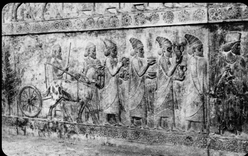
1966 - Irán. Reinas de Persepolis. Bajorelieves del Palacio de Apadana.

Los estudios de ADN. Muy novedosos son en el campo de la arqueología los estudios genéticos sobre restos óseos. Por medio del ADN mitocondrial se pue-