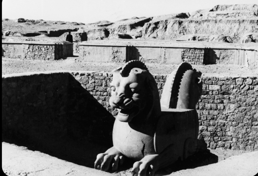
1966 - Ruinas de Persépolis - León de dos cabezas - Capitel -

milia nuclear. Generalmente la observamos en casas cuadradas o rectangulares de uno o dos cuartos. Posteriormente tendríamos los añadidos que generalmente son los hijos casados, y allegados o sirvientes.