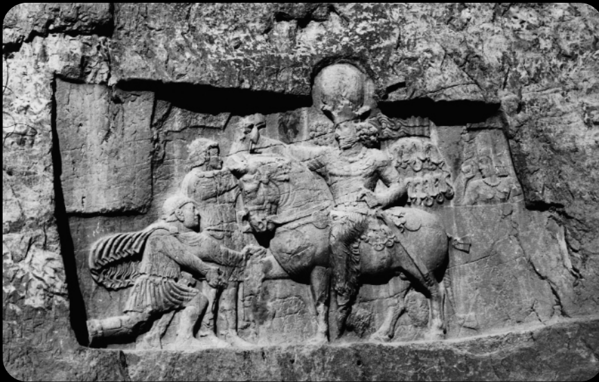
1966 - En la tumba de los Emperadores Persas de la Dinastía Aqueménida, fundada por Ciro - Relieve en la tumba de Darío el Grande.

de establecer grupos genéticamente disímolos, así como sexamiento, proge- nie y parentesco.