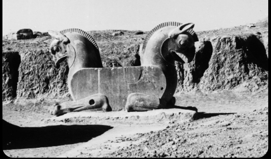
1966 - Persepolis - Aguila de dos cabezas - Capital de la Sala de las 100 Columnas -

Artefactos y desechos. Mucho del tiempo de análisis lo dedica el arqueólogo a los fragmentos de cerámica, figurillas, obsidiana y pedernal (lítica tallada), basalto y otras rocas